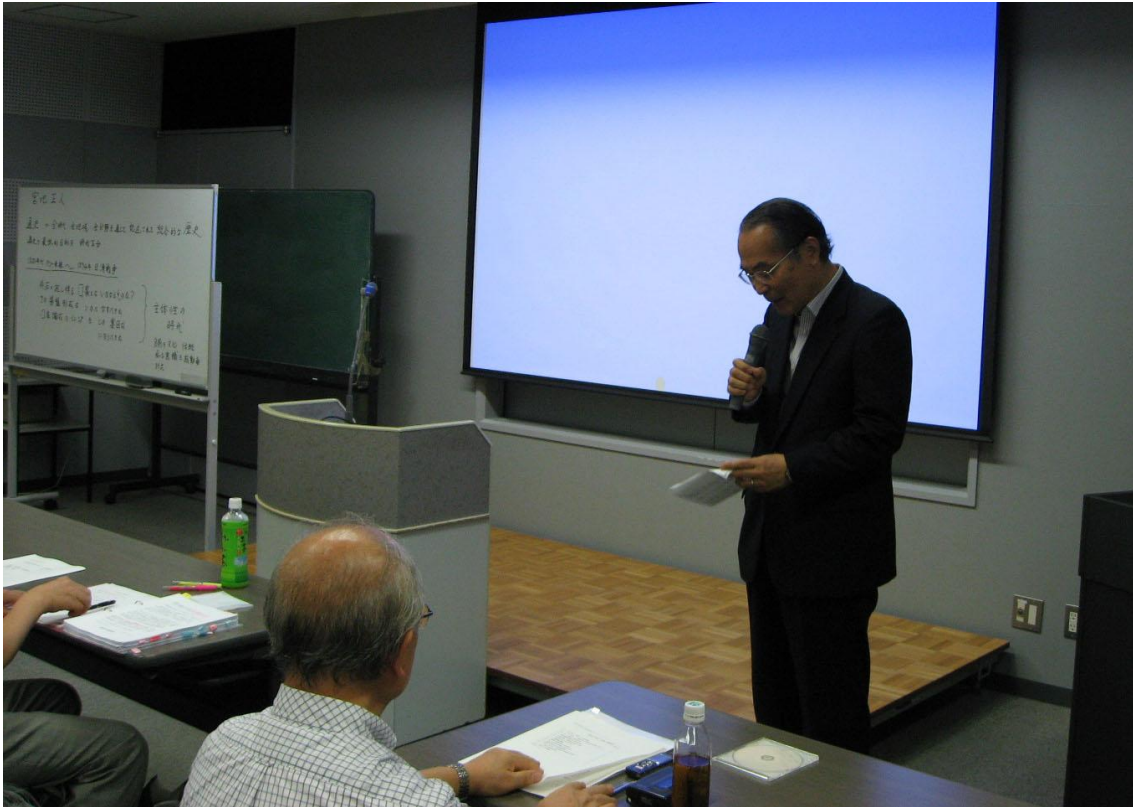
滝澤関東同窓会長ご挨拶