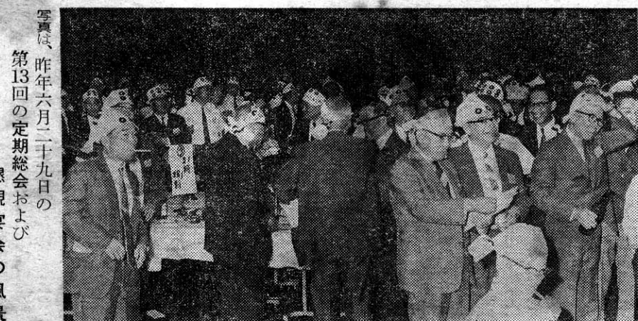
写真は、昨年六月二十九日の第13回の定期総会および懇親宴会の風景