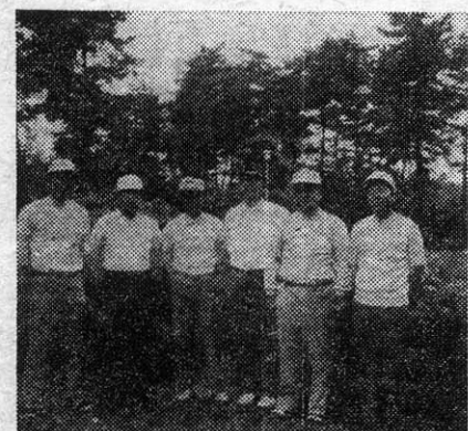
四八ゴルフ会 親しみ競う

よつて、回想させられたものだ。ゴルフ界について観ても、女子プロゴルファーの中にさえ、昨年一年間の賞金だけで、数千万の収入を獲たものがあるなどの報道が、新聞のスポーツ欄では、社会欄に掲げられたことは、それだけの理由があつたことと思ふ。さて、山だらけの小さい島々の日本列島に、ゴルフ場の数が、計画中および建設中のもので加へれば、二千ヶ所を越えるに超えるという、ブームを招いたことには相違ないであろう。 ゴルフ場は、広いものになれば、数十ヘクタールにも達する比較的に平坦な土地を必要とする。二、三千ヶ所以上のゴルフ場の土地を合計すれば、けだし大変大な法野や、森林を潰した事になる。ところで、ゴルフという遊技は何国から始まつたものかという問題には、あるいはイギリスと対して、またあるいはオランダの方が先だと反駁する向もある。何れにしても、本國の国土は狭隘である。海外にべらべらに広大な植民地を領有していた、植民地帝國的何れから始まつたものであつたことには間違いない。 イギリス帝國など、その本國は小さい島々の寄せ集めである。オランダに至つては、別名ネーデルラントという通り、その北海に臨む沿海地方の多くは、海面より低い地域から成つてゐる。イギリス貴族の多くは、海外の植民地で探掘した資源で、狭い母國の中でもうよよと、広大な土地を私有して、その中で、孤狩りを楽しんだり、広い遊技場を設けて、ゴルフを遊ぶが、徒食を繰り返して来たものだ。オランダの世襲の富豪なども、大同小異の生活振りであつたらしい。 広々とした母國内の草原で、独りて小さい白球を打ちながら、クラブ入りの袋を抱えたボーイを共に伴ひ歩くというスポーツは如何にもイギリス人好みの優雅な貴族趣味に合つたもので、自然にそれが貴族のステータス・シンボルの如く視られたので、その遊技は当然やがてエチケットが云々々々されて来たのだ。従つて、ヨーロッパ諸國の一般庶民は、そのよき貴族の遊技を手を出すことを潔しとしなかつた。 然るに、そのような強大な植民地帝國も、第二次世界戦争の結果、広大な植民地をすべて失つたことになり、彼らの母國は、経済的自立が至難なほど、惨な状態に陥つてしまつた。彼らの今日の姿は、過去の間に植民地で苛酷な収奪を繰り返して来た彼ら自身も、旧植民地地帯に苦しめられてゐる苦悶の姿なのだ。ゴルフの話ではないが、以上のように私はゴルフを排斥したり、ゴルフに興ずる日本を蔑視したりしてゐる訳ではない。唯、エチケットの非常にやかましいゴルフを遊ぶ日本人の中に、エチケットを無視した来流石の貴族の遊技もすつかり大