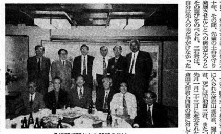
八幡間で開かれた35期の集い