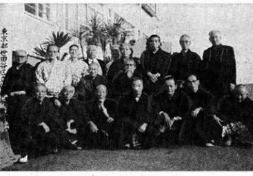
北川荘で開いた三三会の忘年会