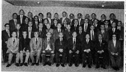
演村、三石両氏を囲んで受章祝賀会の35期生