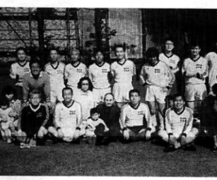
碁部の在任OB会親善試合の、狛江市東中央研究