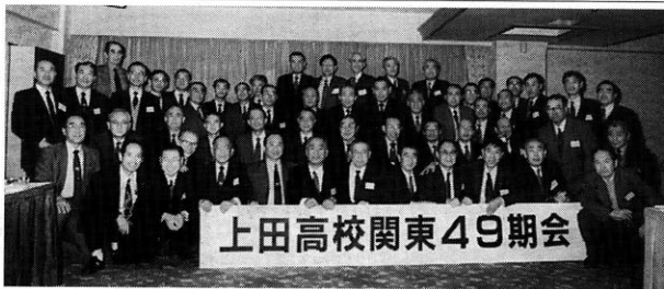
上田高校関東49期会