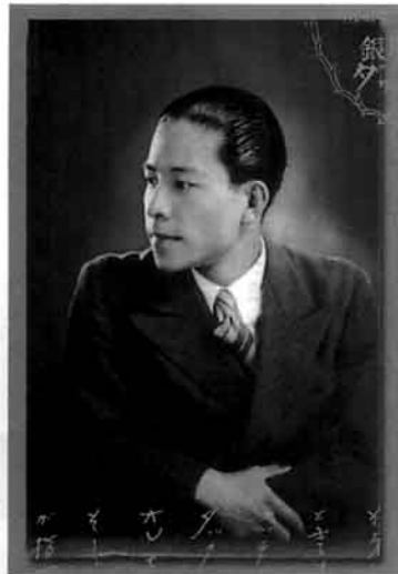
←上中時代の江。1929年のサインも入っている。