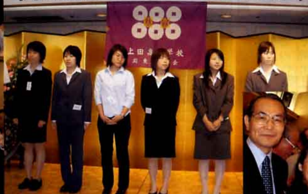
↑ 新人紹介。女性が目立った。 ← 久しぶりに同期で懇談 →

第43回総会に220人参加 母校室内楽班の演奏も堪能 関東同窓会第43回総会は7月4日(日)午後、神田一ツ橋の如水会館で本部の笠原理事長や日野勝校長ら来賓や会員併せて約220人が参加して開催された。総会には母校から初めて在校生の室内楽班約25人が特別に出演、見事な演奏ぶりに参加者は大いに堪能した。(詳細は3ページに)