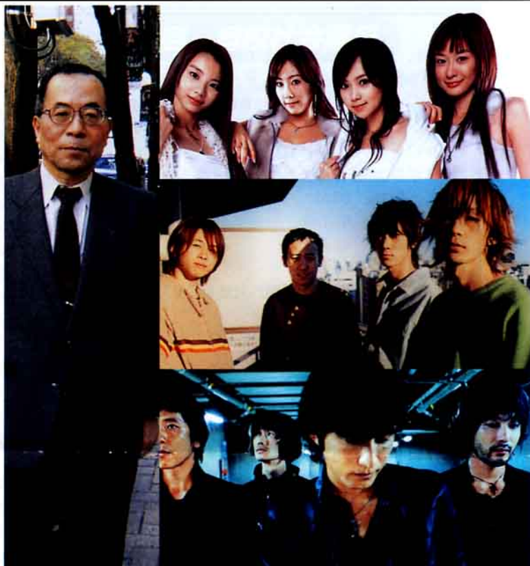
井出さんと、上から Sugar, BUMP OF CHICKEN, Mr.Children

「日テレのドラマ『同窓会』のエンディングに使われた曲“クロスロード”、気が付いたらミリオンセラーに躍り出ていました」最近では海外によく出かける。この1年は特に韓国、中国、台湾に集中して出かけた。「若者の気分は日本も中国も変わりません。日本で人気があるものはどこでも素直に受け入れられる」。所属するバンドの若者達がネットでやりとりして気軽に演奏に行くケースも増えてきたという。「歌ははやりものだが『栄光の架け橋』はスタンダードで残りそう」と笑顔を見せた。