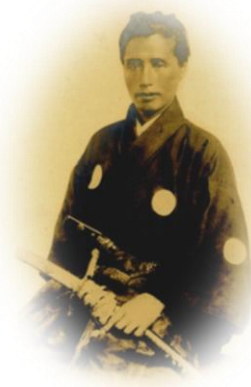
勝海舟