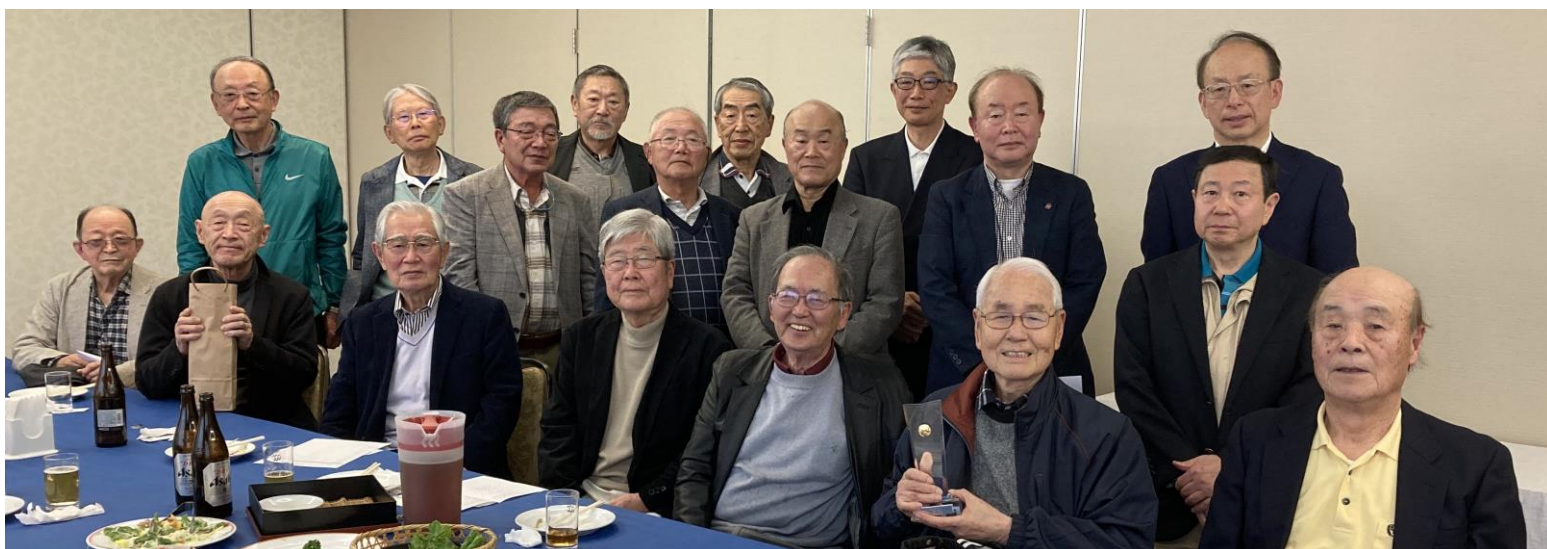
朝雨天のため集合写真は懇親会後に