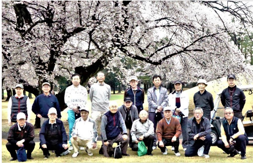
スタート前の集合写真